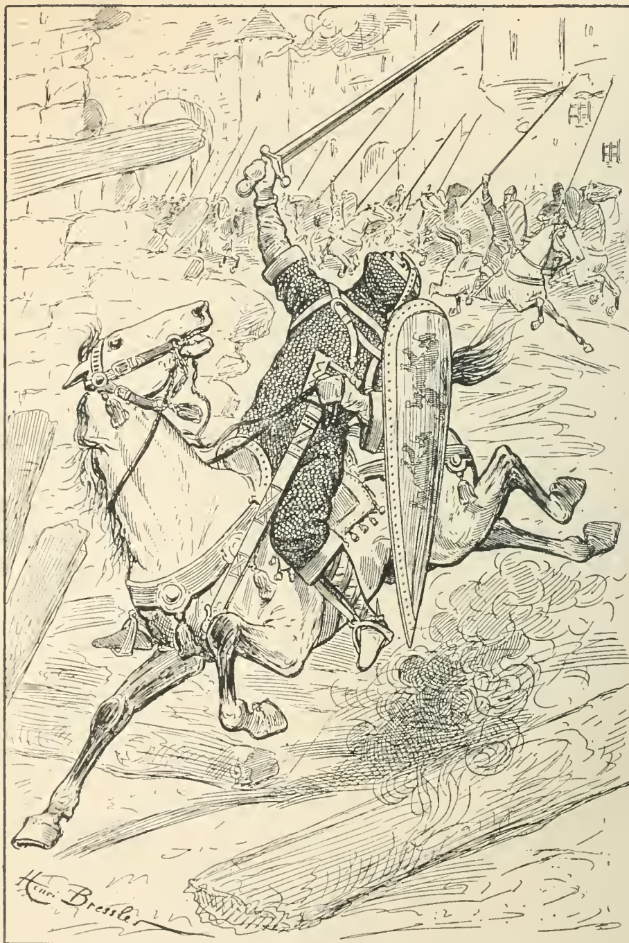
Son cheval mit les pieds sur des charbons... (page 176)